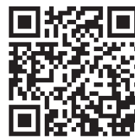
長浜市の部活動改革説明動画