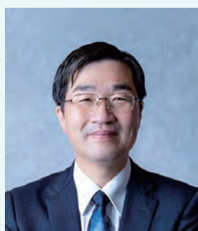
長浜市長 浅見 宣義

この度、湖北市民会議による市民協働事業「KOHOKU未来のブカツプロジェクト」が実施される運びとなり、市民の皆様と団体、企業、行政が一体となって子どもたちの未来を育む、この素晴らしい取り組みに心から敬意を表します。