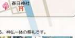
春日神社 平安衣姿に身を包んだ可憐なお稚児さん