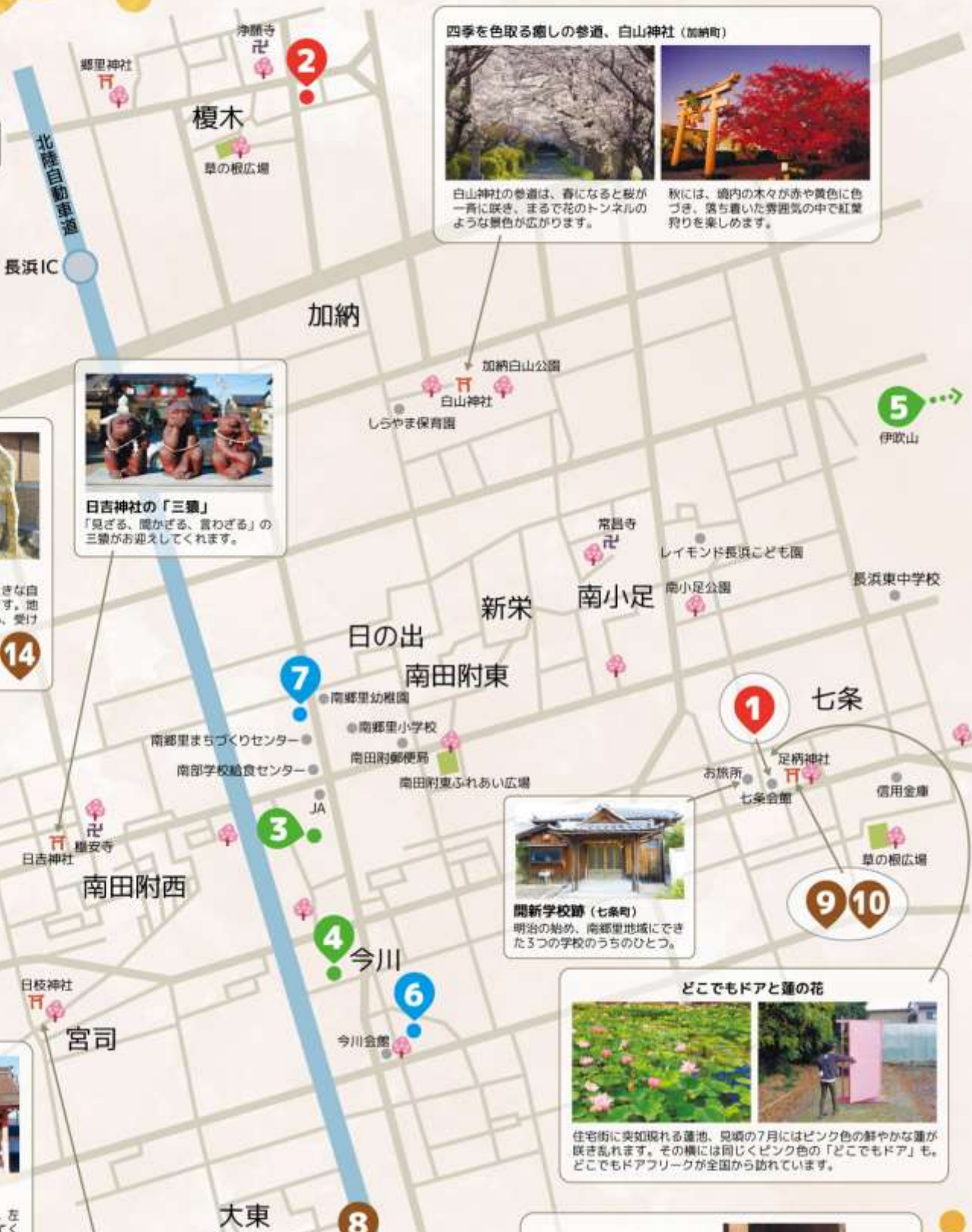
四季を色取る癒しの参道、白山神社（加納町）