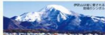
伊吹山は南郷に響き渡る地域のシンボル

季節や時間によって表情を変える、避暑の最高峰・伊吹山。降雪の様子から天候を予報するなど、南郷里の人々の暮らしと共にあります。