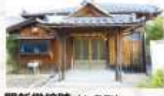
開新学校跡（七条町） 明治の始め、南郷里地域にできた3つの学校のうちのひとつ。