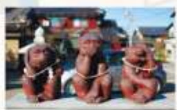
日吉神社の「三猿」 「見ざる、聞かざる、言わざる」の三猿がお迎えしてくれます。

秋には、境内の木々が赤や黄色に色づき、落ち葉の舞い舞いの中で紅葉狩りを楽しめます。