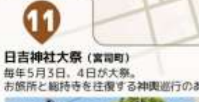
日吉神社大祭（宮司町） 毎年5月3日、4日が大祭。お旅所と総持寺を往復する神輿巡行のある、神仏一体の祭礼です。 重さ約1.5トンの「山王神輿」