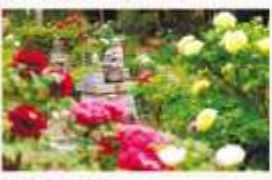
総持寺の牡丹 毎年5月頃になると牡丹が一斉に咲き誇り、大輪の花々が境内を鮮やかに彩る光景は正春、初夏の風物詩として多くの参拝者に親しまれています。