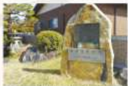
遠州公出生地顕彰碑 遠州公の出生を象徴する大きな自然石の顕彰碑が立っています。地元の方が交代で清掃を行い、受け継いでいます。