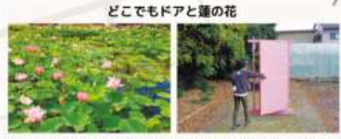
どこでもドアと蓮の花 住宅街に突如現れる蓮池。見頃の7月にはピンク色の鮮やかな蓮が咲き乱れます。その横には同じくピンク色の「どこでもドア」も、どこでもドアフリークが全国から訪れています。