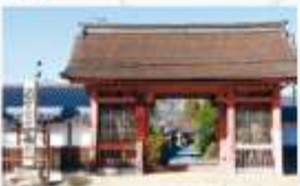
総持寺の大門（宮司町） 総持寺の大門は滋賀県指定文化財。左右に安置されている仁王像が迎えてくれます。この大門は、江戸時代初期の創建ながら、戦山時代の華やかな様式を色濃く残す貴重な建築です。