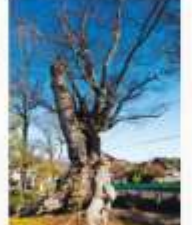
日吉神社、樹齢800年のケヤキ 境内にある樹齢800年を超える大きなケヤキの木