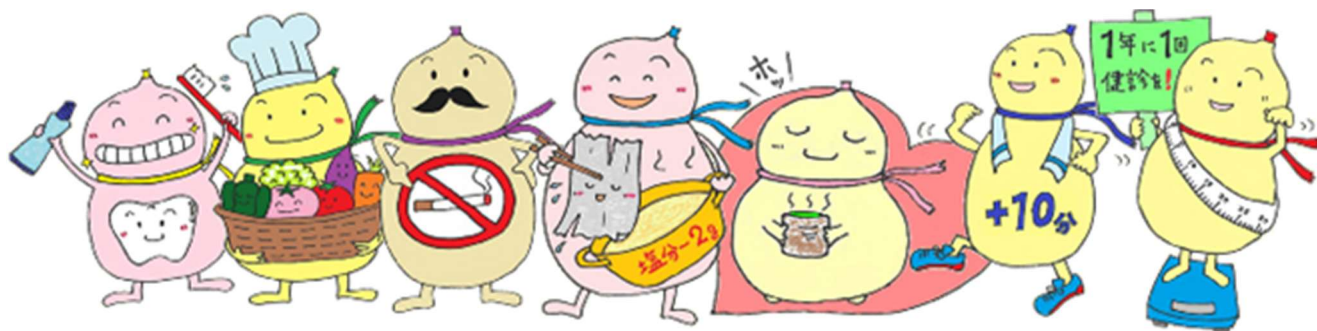
長浜市健康づくり推進キャラクター「むびょうたん+1」