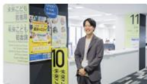
故郷への想いを力に。民間経験を活かし、市民と未来を共創する長浜市役所の働き方 #職員インタビュー #長浜市役所紹介 2025/10/06