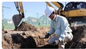
「歴史はロマン」。過去と未来を結ぶ、文化財技術職の醍醐味 #職員インタビュー NEW 2025/10/10