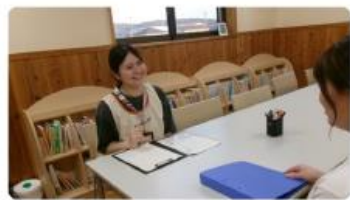
子どもの笑顔と向き合い続けるプロフェッショナル。長浜市児童発達支援センターで働くある職員が大切にしている… #長浜市役所紹介 #職員インタビュー 2025/10/07