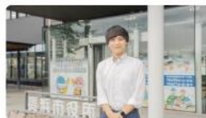
全国転勤の民間メーカーから長浜市役所へ。暮らしと仕事、両方の「チャレンジ」で見つけた新たなキャリアパス #職員インタビュー #長浜市役所紹介 2025/10/06