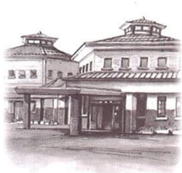
六荘まちづくりセンター 徳田 憲治氏 作画