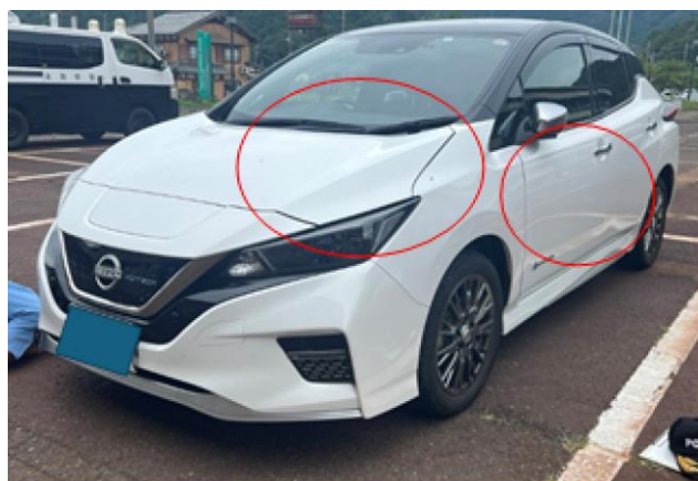
ボンネットの歪み、ドアの歪み