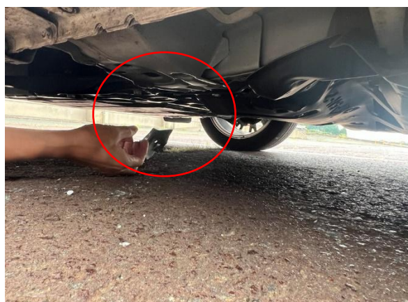
車両下部の損傷・部品脱落