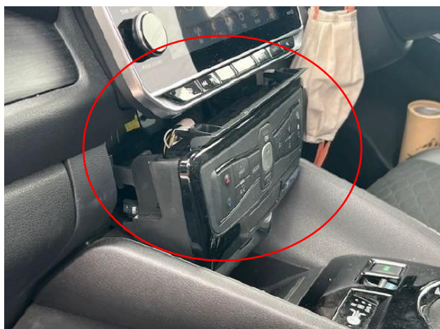
エアコンユニットの脱落