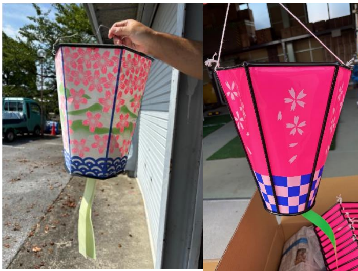
ぼんぼり（2種類あり）