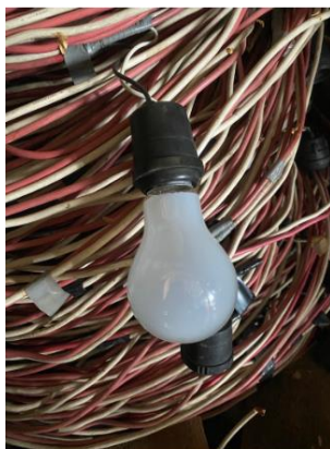
絶縁電気線（電灯ソケット＋絶縁電気線）