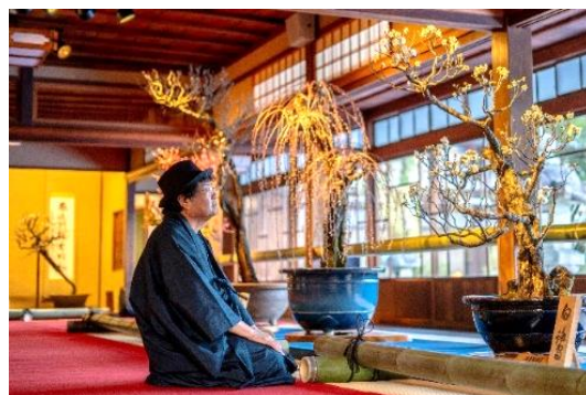
13º Concurso de fotografias Prêmio Presidente da Câmara Municipal de Nagahama [Ume to Kataru – Conversando com as ameixeiras]

Informações: Nagahama Kankou Kyoukai TEL.: 0749-53-2650