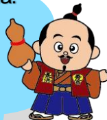
Hideyoshi kun Mascote Propaganda do Nagahama Kankou

Buscamos incentivar o consumo e estimular as compras no município, ao mesmo tempo em que oferecemos suporte ao comércio local, impactado pela alta dos preços, e assim, promover a revitalização da economia regional e fomentar um ciclo positivo de crescimento.