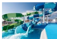
Nagahama Shimin Pool (japon s)