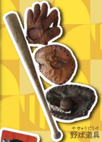
やきゅうどうぐ 野球道具