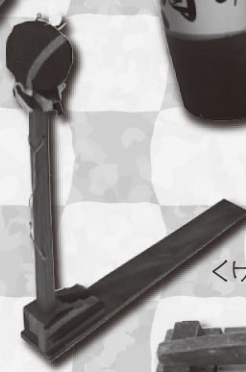
だい わさいどうぐ くけ台(和裁道具)