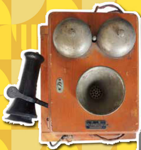
かべ でんわ 壁かけ電話