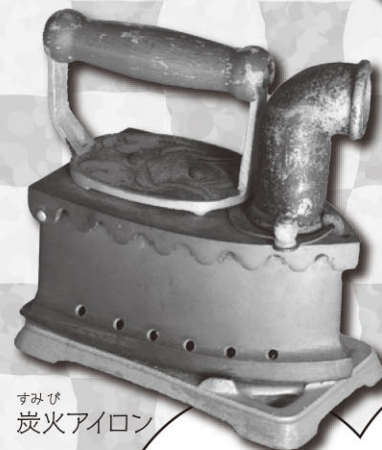
すみび 炭火アイロン