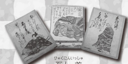
ひゃくにんいっしゅう 百人一首