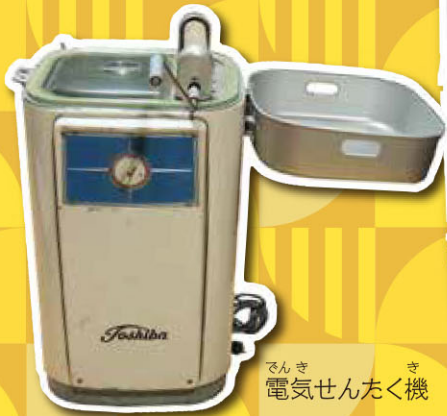
でんき 電気せんたく機