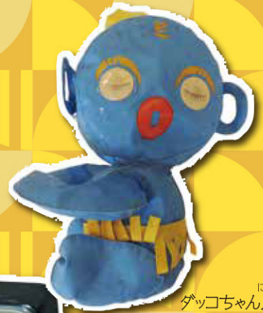
にんぎょう ダッコちゃん人形