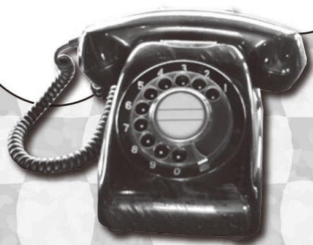
くろでんわ 黒電話