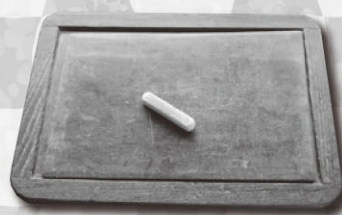
せきばん せきひつ 石盤と石筆