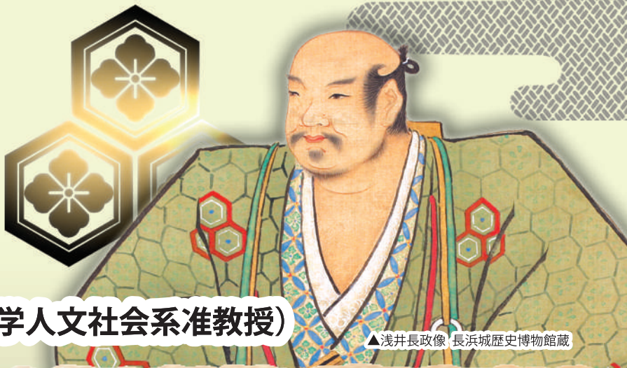
▲浅井長政像 長浜城歴史博物館蔵