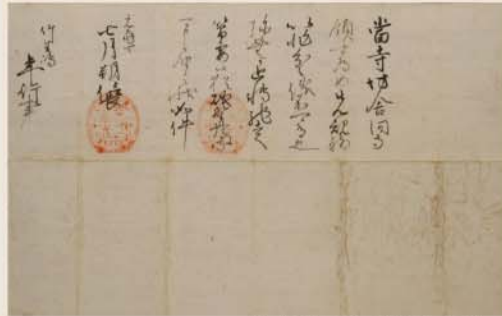
織田信長朱印状 竹生嶋年行事宛 重要文化財 竹生島宝厳寺蔵