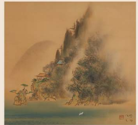
竹生島図 杉本百郎筆 長浜城歴史博物館蔵

展示説明会 令和6年5月11日(土)午後1時30分~ 長浜城歴史博物館 2階展示室