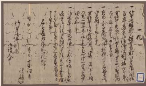
江戸表御開帳二付乍序当寺江請侍仕二付一札 竹生島宝厳寺蔵