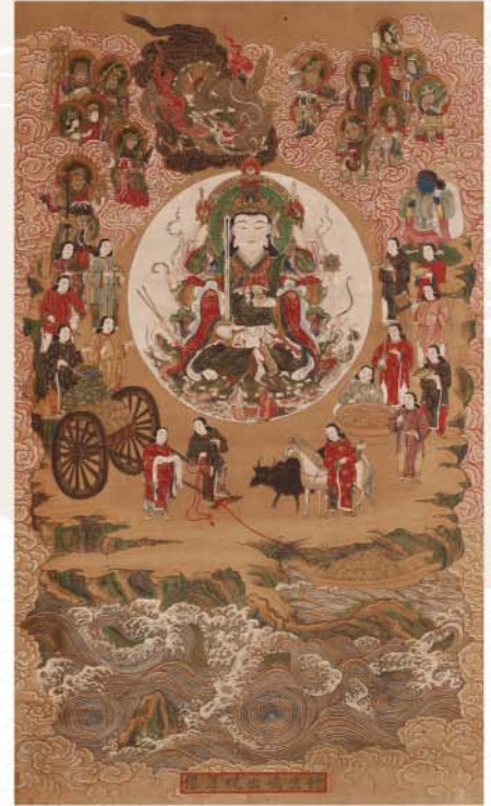
竹生嶋出現尊像 長浜城歴史博物館蔵