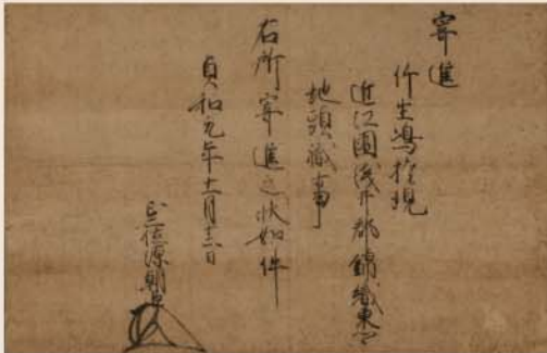
前期展示 足利尊氏地頭職寄進状 重要文化財 竹生島宝厳寺蔵