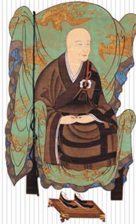
御開山如仲禪師頂相