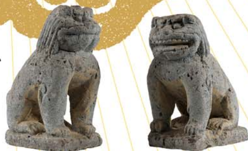
石造 狛犬

※団体は20名以上。長浜市・米原市の小・中学生は無料。 ※身体障害者手帳・療育手帳・精神障害者保健福祉手帳等をお持ちの方及びその付添いの方1名は無料。(ただし、証明となる手帳等の提示が必要)