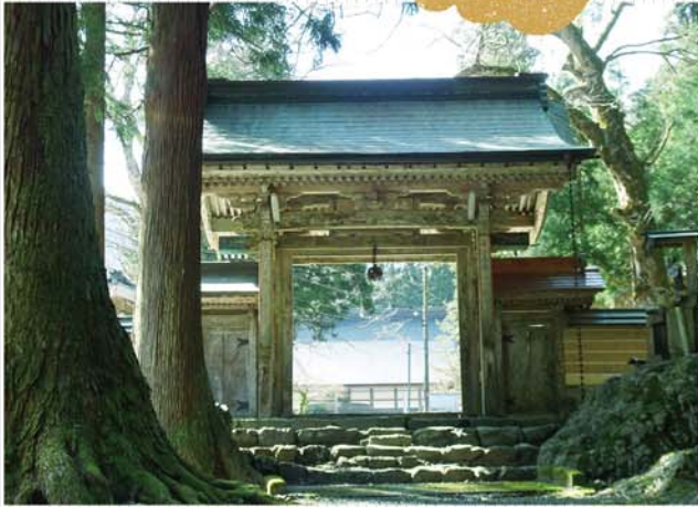
洞寿院（滋賀県長浜市余呉町菅並）

この展示では、菅並洞寿院に伝わる仏教美術をおして、丹生谷の歴史と仏教文化を概観します。