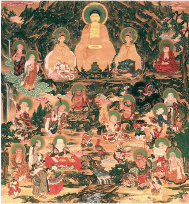
釈迦三尊十六羅漢図