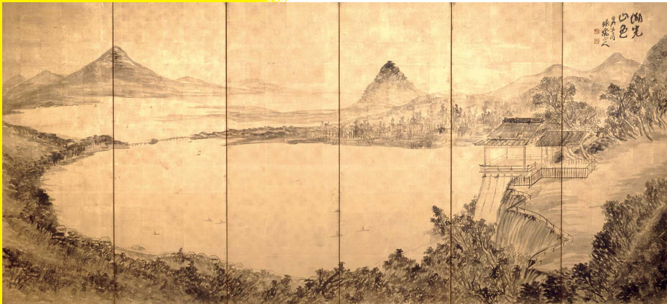
琵琶湖図 (湖光山色図)